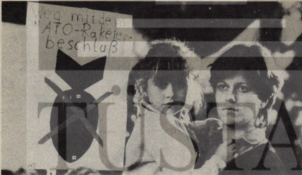
Alman Demokratik Cumhuriyeti'nde yediden yetmiş herkes savaşa karşıdır.

Quandt 1931'de Mecklenburg'dan milletvekili seçildi ve 1945'ten sonra da doğduğu yerlerde sosyalizmin yerleşmesine yardımcı oldu. Doğduğu Almanya'daki endüstri kentleri ve bölgelerinin -Saksonya, Thüringia, Berlin - sos-