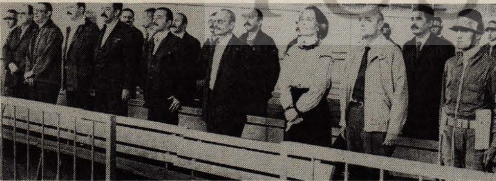
Yeni Barış Derneği davası açılırken, Yargıtay'dan "eksik soruşturma" nedeniyle dönen 1. Barış Derneği davasına yeniden başlandı. Fotoğrafta 1. Barış Davası sanıkları görülüyor.

Hergün bir yenisi açılan, bir kaçı bitirilen, idam, ömürboyu ve düzinelere yıl hapis cezalarının bir çırpıda verilebildiği, infaz mangalarına harıl harıl kurbanlık insan yetiştirilmek için gece gündüz çalışan faşist sıkıyönetim mahkemeleri davaları yeni yeni ilavelerle kabarmaya devam ediyor. Ekim ayı içinde siyasi polis daha çok "iş" yaptı, savcılar daha çok çalıştı, yargıçlar bir hayli imza attı ve bir kaç kalem kırıldı!