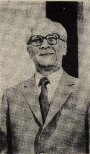
Alman Demokratik Cumhuriyeti Devlet Konseyi Başkanı ve Sosyalist Birlik Partisi Merkez Komitesi Genel Sekreteri Erich Honecker.

Herkes sürekli olarak çalışabileceği bir iş, son 10 yılda ortalama % 4.6'ya varan ulusal gelir artışı, on yıllardır sosyal hizmetlerde görülen gelişmeler yanında, kiralarda ve günlük ihtiyaç maddelerinin fiyatlarında değişmezlik; işte bu yıl 7 Ekim'de 35. yılını dolduran Avrupa'nın en genç en genç devleti olan Alman Demokratik Cumhuriyeti (ADC)